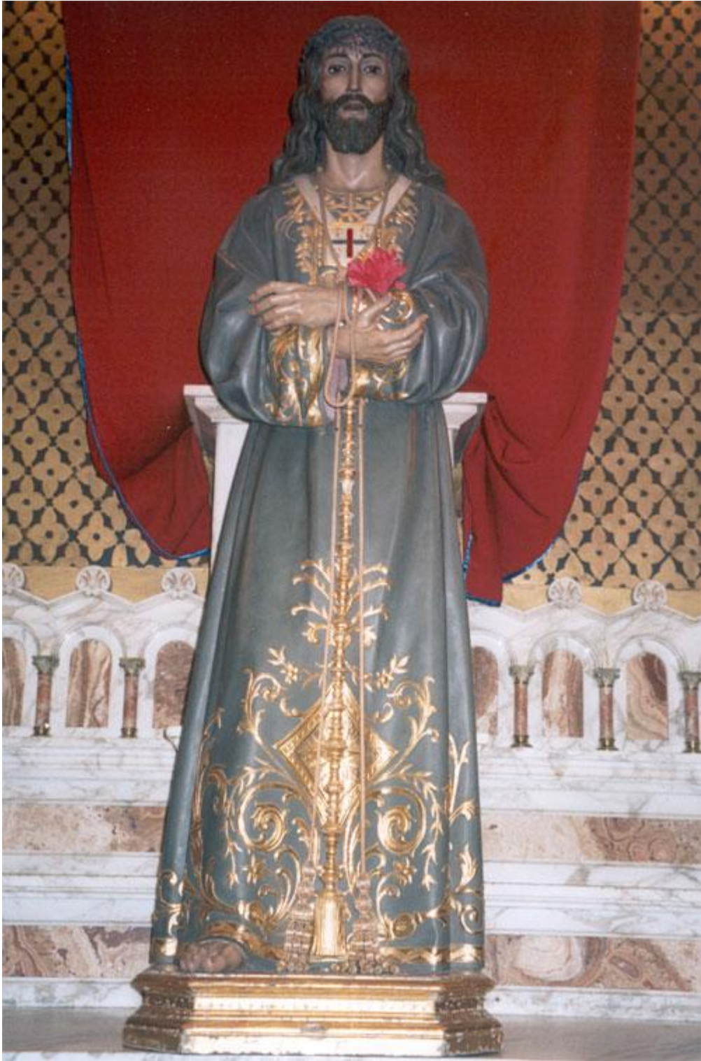
Altar e imagen de Jesús Nazareno. Se halla en el extremo de la nave derecha, antes del presbiterio y enfrente de la Virgen del Buen Remedio, situada en el mismo lugar de la nave izquierda.-