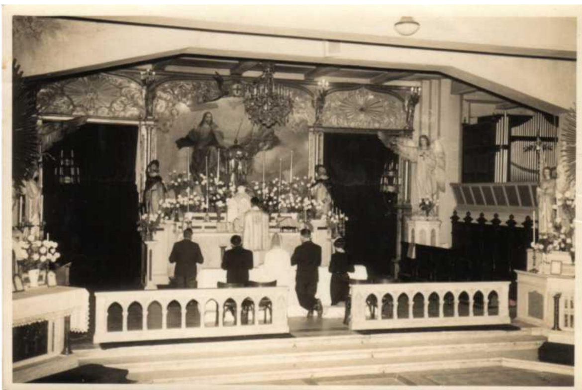
Imagen del altar mayor durante un casamiento (3 de junio de 1964).

El Altar Mayor de la Parroquia de la Santísima Trinidad se encuentra rodeado de cinco cuerpos de sillería de caoba.